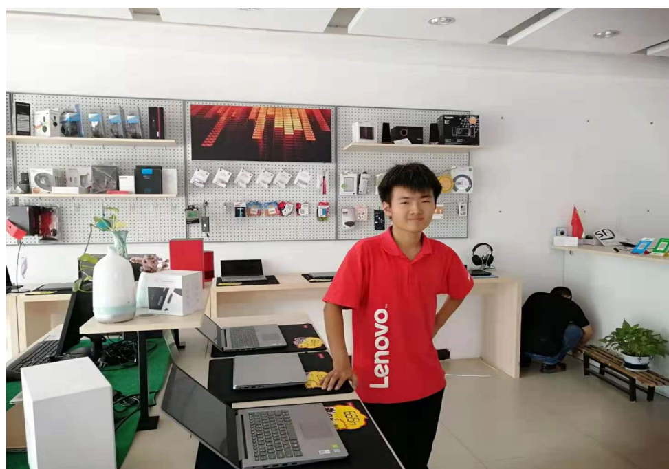
我专业教师对毕业生跟踪调查