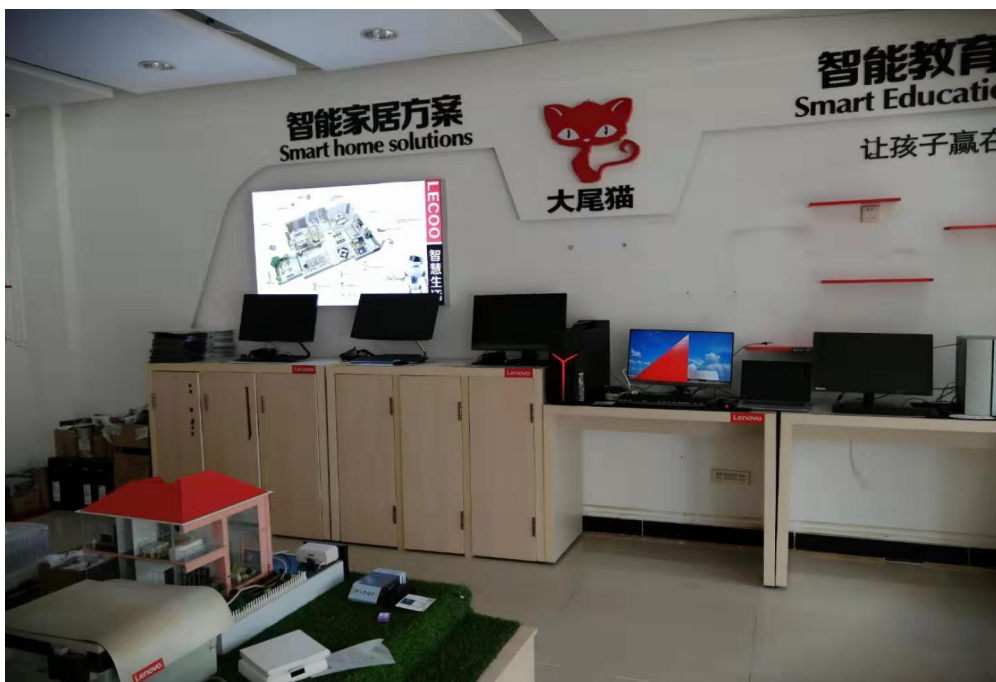
我专业教师赴企业跟踪调查